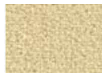
Chaume 615 4 + 5 m