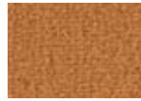
Caramel 660 4 m