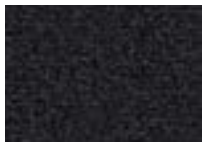
Ébène 999 4 m