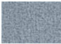
Étain 948 4 + 5 m