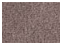
Taupe 775 4 + 5 m