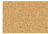
Daim 348 4 m