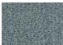
Cendre 955 4 m