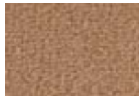
Cannelle 760 4 m