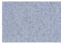
Mercure 945 4 m