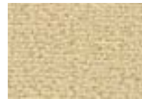
Garrigue 630 4 + 5 m