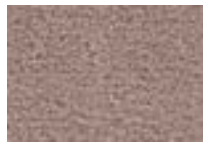
Sépia 758 4 + 5 m