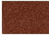
Arabica 790 4 m