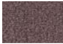
Fusain 780 4 m