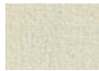
Nacre 003 4 m