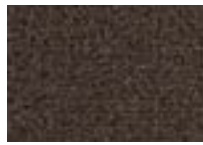
Bois 795 4 m