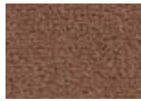
Écaille 768 4 + 5 m