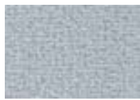
Armure 918 4 + 5 m