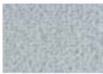
Perle 940 4 m