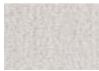
Givre 900 4 m