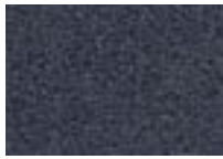
Charbon 988 4 + 5 m