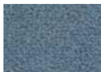
Onyx 975 4 m