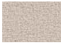
Loup 710 4 m