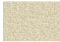
Érable 010 4 + 5 m