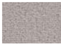
Lièvre 733 4 + 5 m